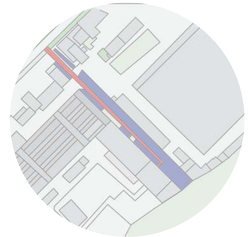
POTENCIALIOS, NEIŠNAUDOTOS ERDVĖS

Aplink akligatvį dominuoja mišrios paslaugos: geltona spalva žymima komercija , mėlyna – sporto paskirties pastatai.